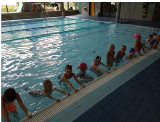
Obrázek 4: plavecký výcvik v centru Na Fialce