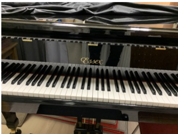
Obrázek 3: klavír Essex v hudebně MŠ

Běžná nabídka je cca 10 kroužků, ale díky opatřením týkajících se COVID 19 nebyly otevřeny.