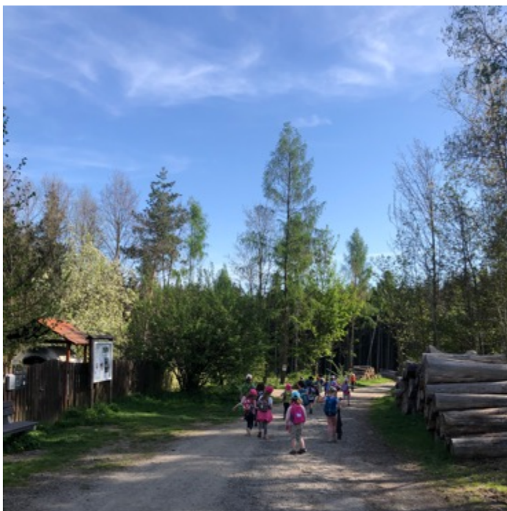
Obrázek 5: výlet do lesa ve Světicích

V případě pěkného počasí se děti vydávaly vlakem či autobusem na procházky do přilehlých lesů, kde si užívaly pobytu v přírodě a zároveň se učily poznávat stromy, keře i rostliny.