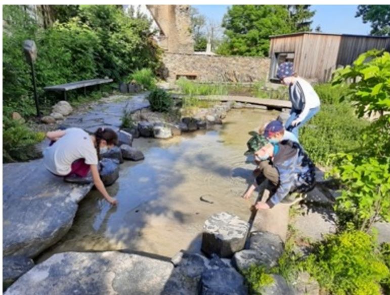
Obrázek 6: Geopark