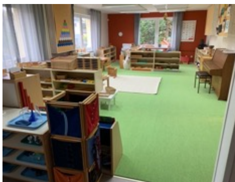
Obrázek 2: pohled do třídy MŠ po rekonstrukci