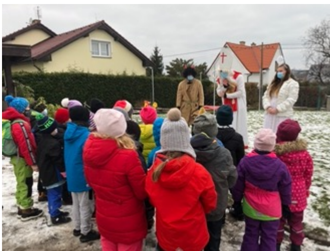
Obrázek 7: Mikulášská nadílka