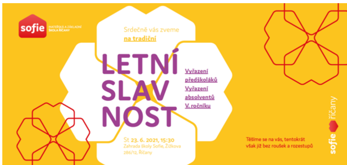
Obrázek 8: závěrečná letní slavnost – pozvánka

Celou slavností nás doprovázel zpěv dětí a žáků MŠ a ZŠ Sofie, dětmi připravené scénky doprovázené moderováním paní vedoucí vychovatelky Jany Jägerové.